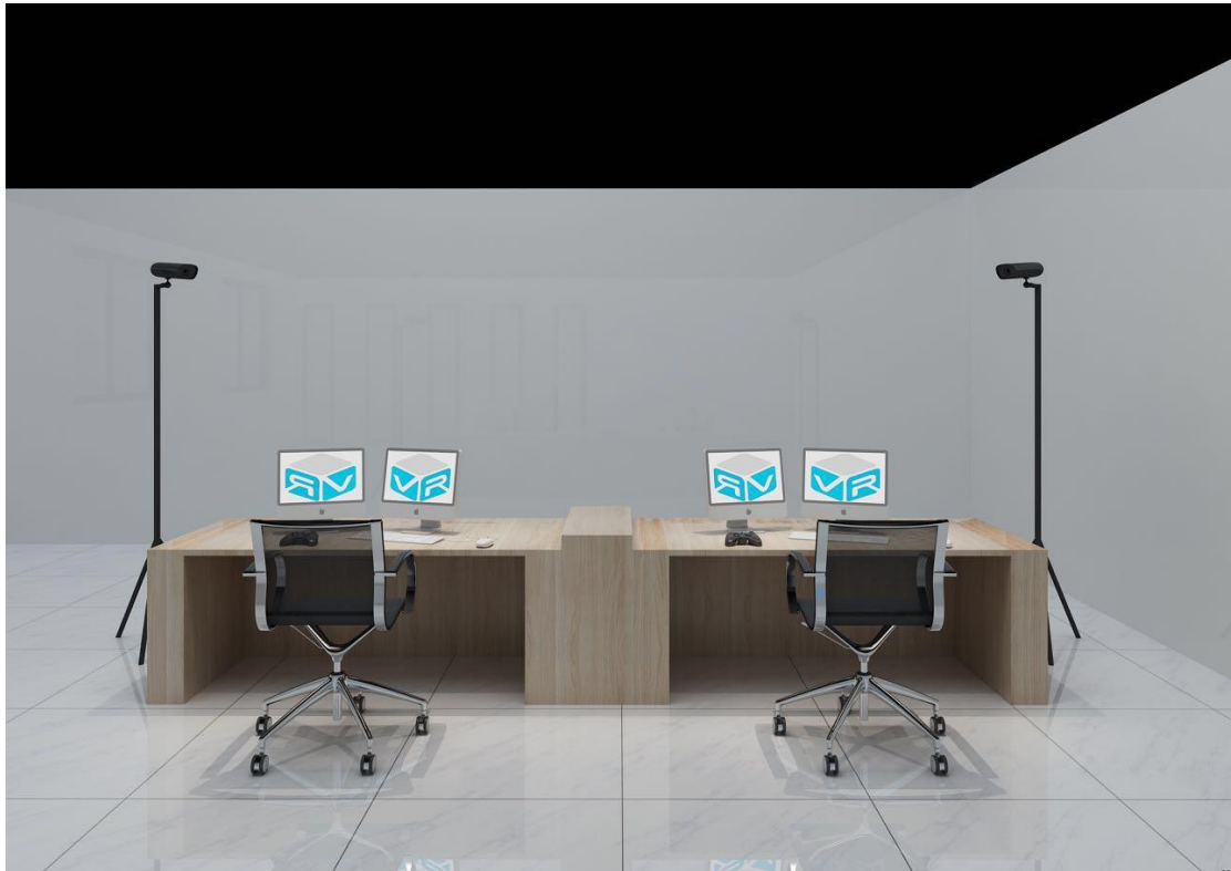
图 3 竞赛工位效果图